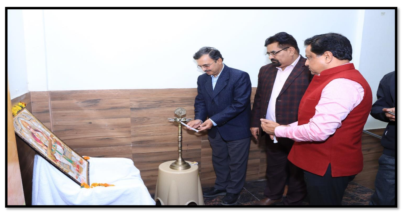
Lighting of Lamp during inauguration by dignitaries