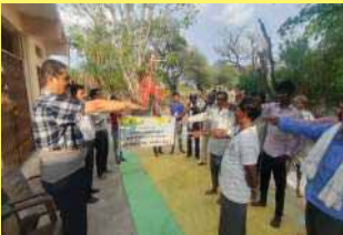
मध्य प्रदेश (रायँसेन)