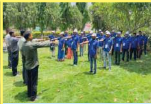
मध्य प्रदेश (सिहोर)