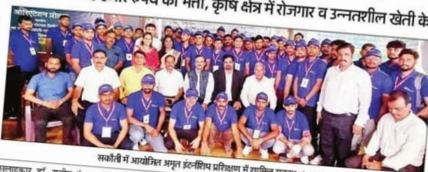
सर्कोती में आयोजित अमृत इंटरशिप प्रशिक्षण में शामिल

युवाओं को कार्यक्रम के बारे में प्रशिक्षण देने के लिए एक दिवसीय ऑरिएंटेशन कार्यक्रम आयोजित किया गया, जिसमें आईपीएस फ़ाउंडेशन के बरिष्ठ